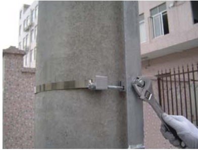
11、重复上一操作步骤，将另一颗余缆架固定螺母拧紧。