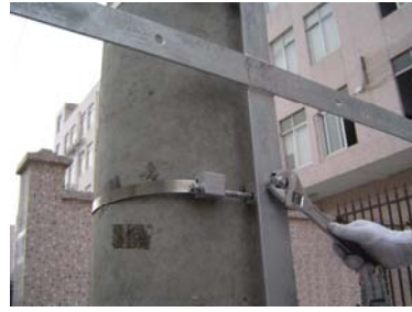
10、戴上余缆架固定螺母，并拧紧。