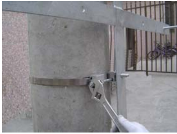
9、重复 1~6 步骤的操作，调整好余缆架的位置，拧紧螺栓。